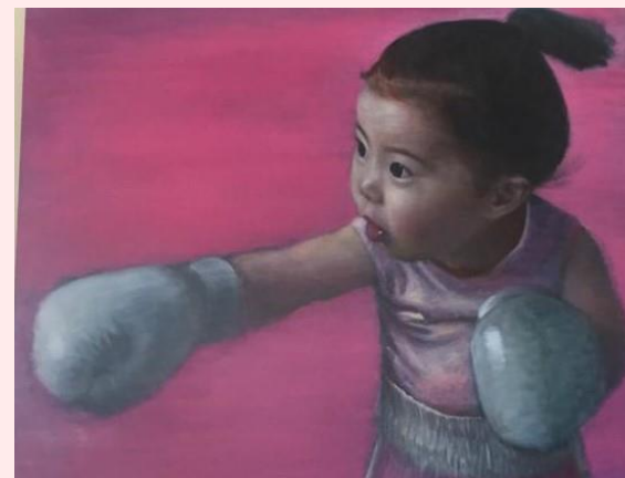
Senza titolo, collezione privata

Centro di Ricerca di Psicoterapia Scuola di Specializzazione in psicoterapia a indirizzo psicoanalitico - MIUR 16.11.2000 socio O.P.I.F.E.R., socio S.I.E.F.P.P., socio A.I.P.C.F., socio C.N.S.P., socio MIND ORDER Milano