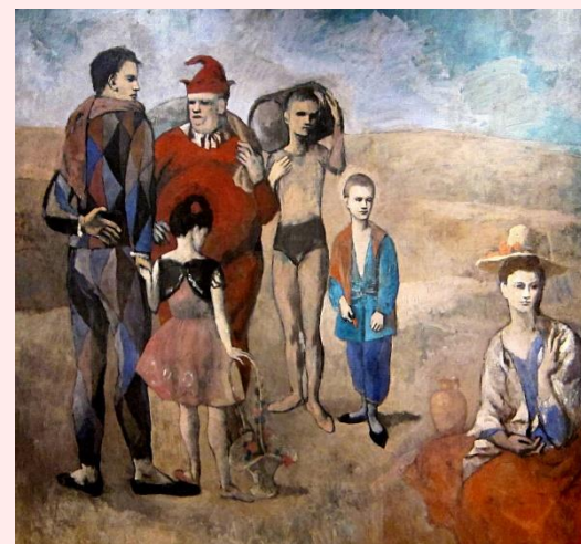
P. Picasso, La Famille des Saltimbanques, 1905